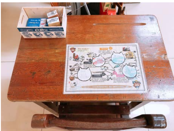
學習單集章兌換贈品