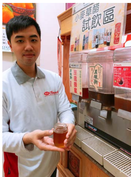
品嚐小麥草活性酵素醋飲