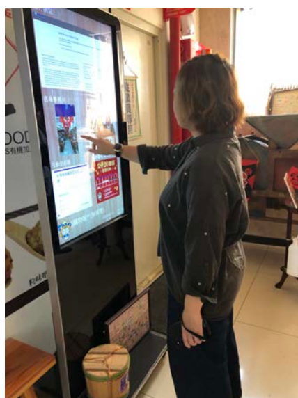
智慧導覽互動體驗