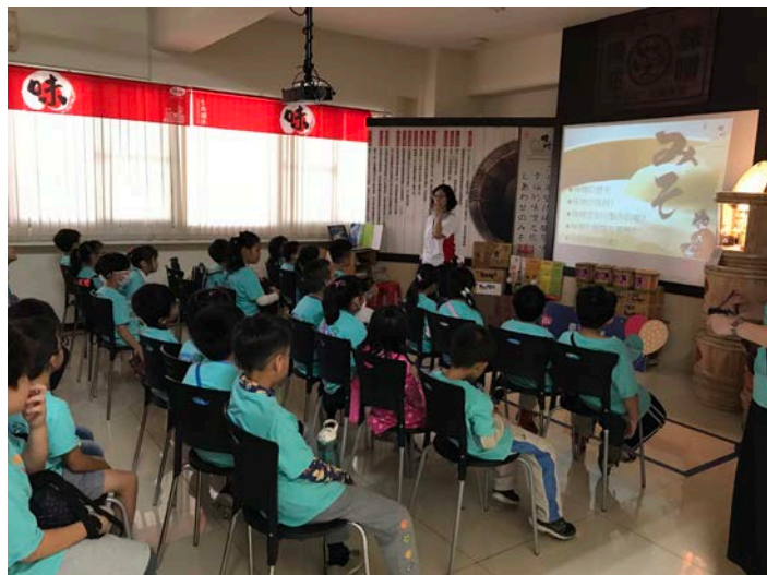
味噌歷史知識簡報