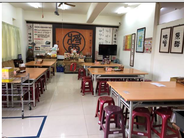
DIY教室 (5樓可納120人) (2樓可納50人)