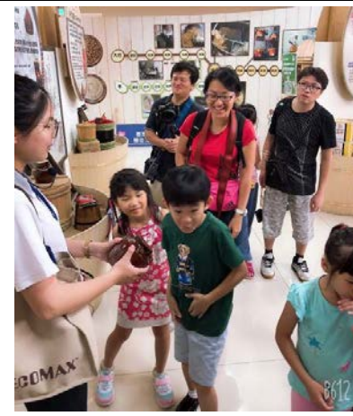
味噌種類風味體驗