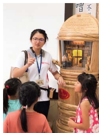
袖珍木桶模型解說