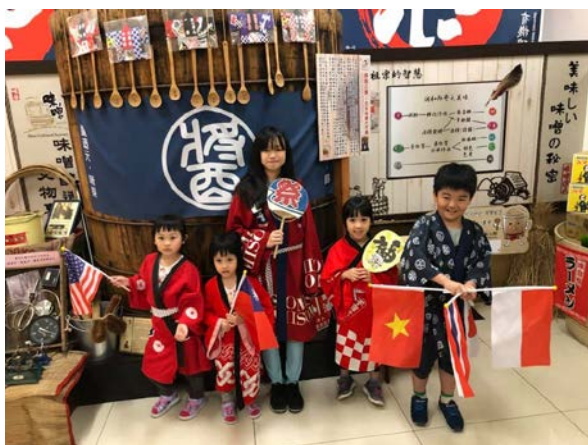
釀造小職人換裝體驗拍照