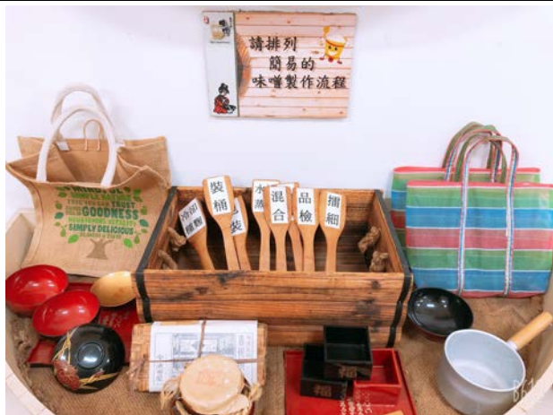
釀造知識問答互動