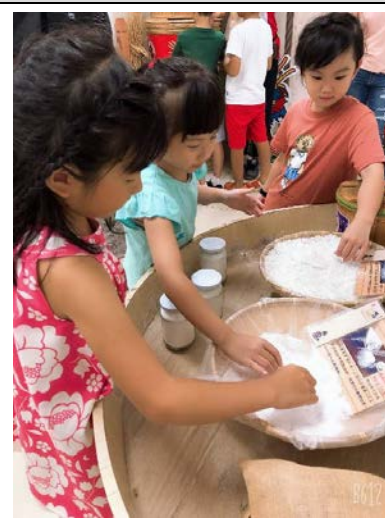
文化走廊觸摸體驗